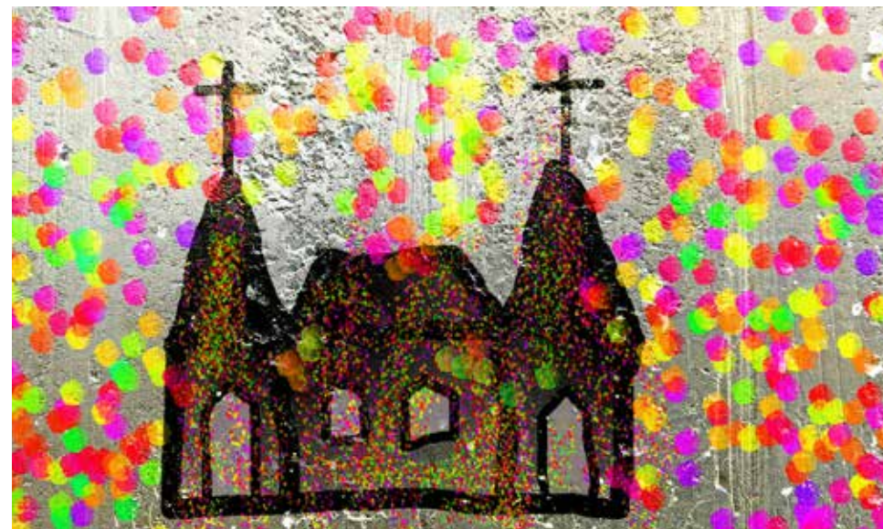
Bild: Pfingsten macht die Kirche bunt Peter Weidemann In: pfarrbriefservice.de